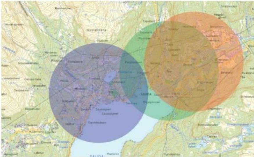
Figur 2 - Kvar sirkel har ein radius på 2 km med senter i kvar sin barneskule. Blå=Risvoll, grøn=Fløgstad, raud=Austarheim. Undersøkingar viser at andelen som går/syklar til skulen fell drastisk når skulevegen blir over 2 km. Dersom målet er at flest mogleg elevar i kommunen skal gå/sykla til skulen, så vil det vera best å behalda to skular: Austarheim og Risvoll. Kartunderlag: Temakart Rogaland.

Det same gjeld for barnehagar. Å samla alle småbarn i ein felles barnehage sentralt i Sauda (t.d. Veslefrikk) vil generera ein auke i biltrafikk i samband med levering og henting. Dette vil vera negativt mtp klimagassutslepp, men også for lokale utslepp og ureining til luft i nærmiljøet rundt denne barnehagen. Omvendt vil ein «desentralisert» struktur med fleire mindre barnehagar gjera at fleire vil kunne gå/sykla til barnehagen. I tillegg vil barnehagane (og skulane) sine uteanlegg vera tilgjengeleg som leikeareal i nærmiljøet til barnefamiliane om ettermiddagar og i helger/feriar.